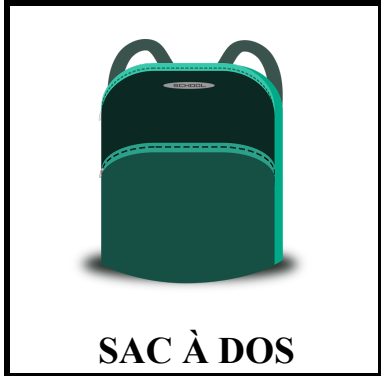
SAC À DOS