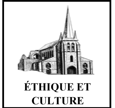
ÉTHIQUE ET CULTURE